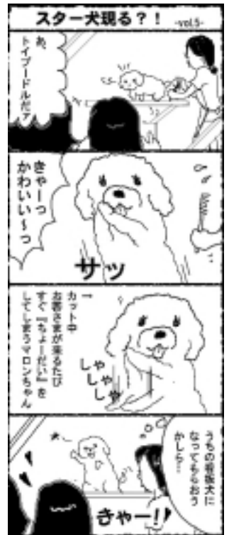
*この漫画は事実を基にしたフィクションです。

私には、付き合って5年になる彼がいます。5年たってもラブラブです。(笑)いろいろケンカもしますが、すぐ仲直り。どんなイイ人を見ても、彼がイイなあと思います。今は休みが合わず、1日中のデートはできないんですが、これから先どんな出来事があったって、彼一筋でいっしょに生きていこう!