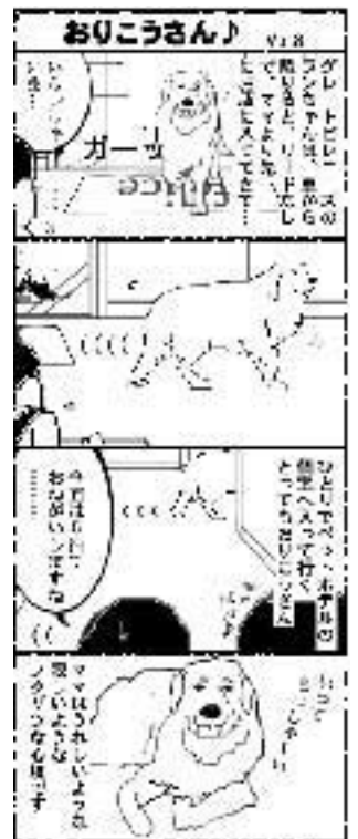
*この漫画は事実を基にしたフィクションです。